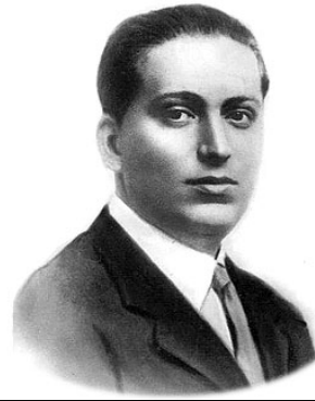
José Calvo Sotelo