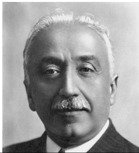
Niceto Alcalá Zamora